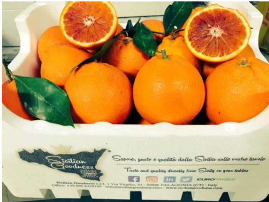
Arance a polpa rossa

Sicilian Goodness (questo il suo nome) nasce da un progetto finalizzato all'esportazione dei prodotti siciliani, servendo clienti B2B e B2C tramite la piattaforma e-commerce del sito web: www.siciliangoodness.com ( http://www.siciliangoodness.com/ ).